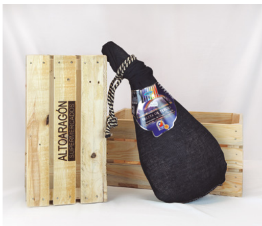
❄ REFERENCIA 7