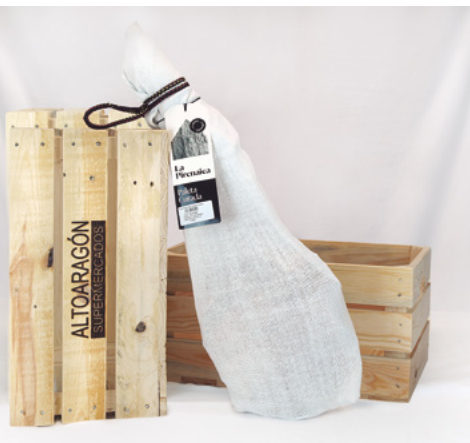
❄ REFERENCIA 6