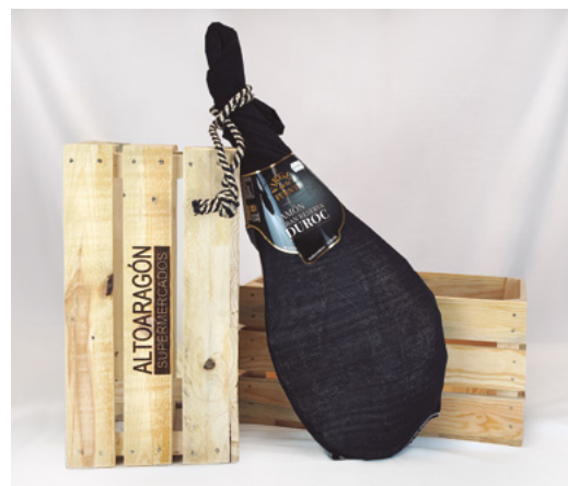
❄ REFERENCIA 14