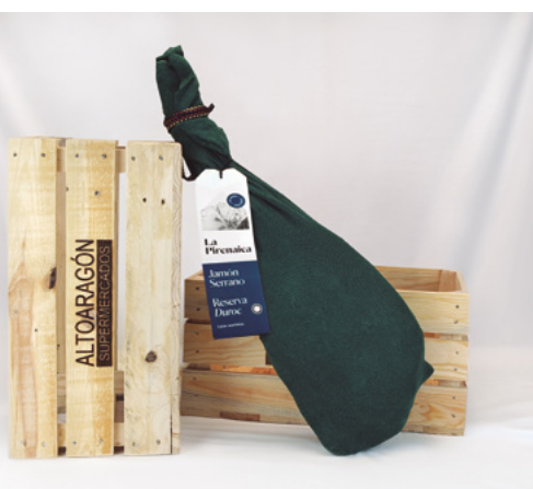
❄ REFERENCIA 12