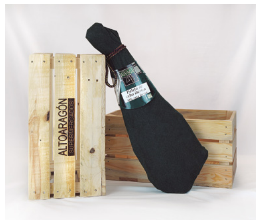
❄ REFERENCIA 8