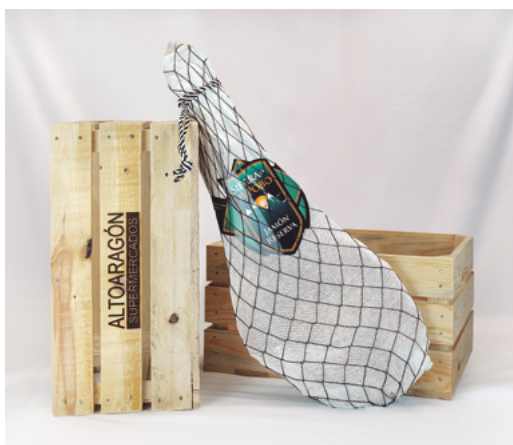
❄ REFERENCIA 13